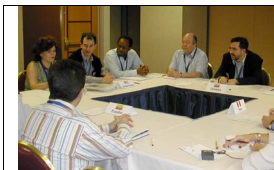
Segunda Ronda del TLC. Mesa de jefes, junio de 2004, Atlanta, Estados Unidos.

Los aspectos institucionales del Tratado abarcan declaraciones de tipo político y los mecanismos de administración del Tratado; y están contenidos en el preámbulo, y los capítulos disposiciones generales, administración, solución de controversias y disposiciones finales.