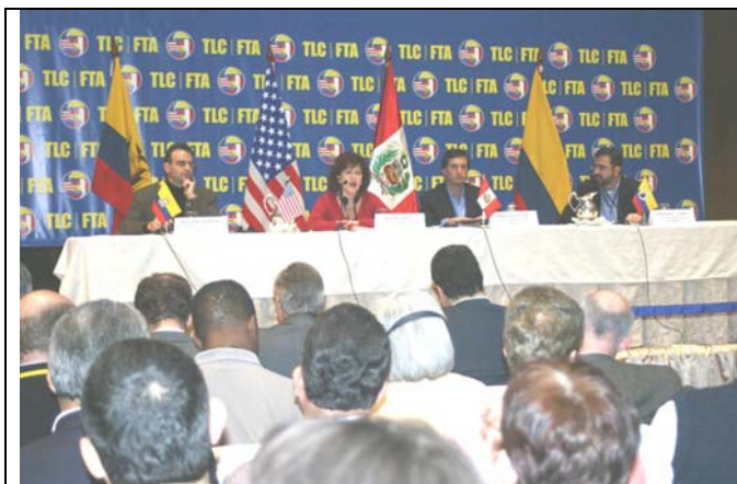
Tercera Ronda del TLC. Rueda de Prensa, Julio 26 de 2004, Lima, Perú.

El objetivo central de Colombia era garantizar que la agricultura nacional quedara como ganadora neta, de suerte que el balance de la negociación fuera la resultante entre las necesidades de exportación de productos agropecuarios y la protección razonable de la producción nacional que pudiere verse afectada por la competencia estadounidense.