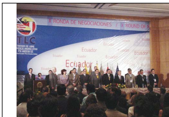
Décima Ronda del TLC. Instalación, Guayaquil, Ecuador, junio de 2005.

El capítulo de Medio Ambiente trata dos elementos principales: la adopción de unas obligaciones en materia de protección al medio ambiente y la definición de unos elementos de cooperación entre las partes que faciliten el cumplimiento de esas obligaciones. Tal como se consagra en el Capítulo, la obligación fundamental, para todos los participantes en el Tratado, consiste en hacer cumplir su propia legislación nacional en materia ambiental.