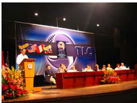
Primera Ronda del TLC. Instalación, Cartagena, 18 de mayo de 2004.

Estados Unidos es nuestro principal socio comercial; compró alrededor del 40% de las exportaciones de bienes del país en 2005 y le compramos cerca del 30% del total de nuestras importaciones. Con el TLC se espera que las exportaciones aumenten en US$1.700 millones y el comercial global en US$3.500 millones.