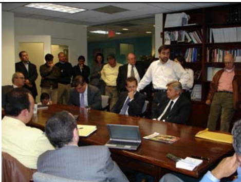
Décimo cuarta Ronda del TLC. Consultas con el sector privado, Washington, Estados Unidos, febrero de 2006.

De igual manera, se hizo una reserva sobre el derecho de Colombia para adoptar o mantener medidas relacionadas con las tierras comunales de los grupos étnicos, con base en el contenido del artículo 63 de la Constitución; éste artículo señala que "...las tierras comunales de grupos étnicos, las tierras de resguardo... y los demás bienes que determine la ley, son inalienables, imprescriptibles e inembargables".