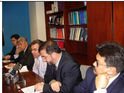
Reanudación Décimo Cuarta Ronda del TLC. Cierre de la mesa de Propiedad Intelectual, Washington, Estados Unidos, febrero de 2006.