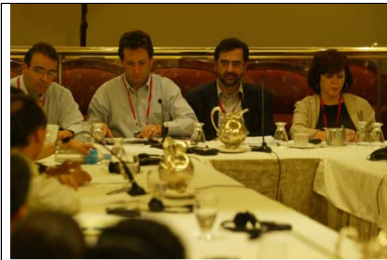
Novena Ronda del TLC. Reunión de jefes negociadores, Lima, Perú, abril de 2005.

El capítulo de Asuntos laborales del TLC tanto Estados Unidos como Colombia se comprometen a cumplir su propia legislación laboral y a respetar los derechos fundamentales de los trabajadores, internacionalmente reconocidos mediante los acuerdos de la Organización Internacional del Trabajo – OIT-.