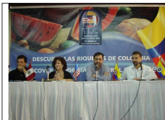
Séptima Ronda del TLC. Rueda de Prensa, Cartagena, febrero de 2005.

Además de los aspectos institucionales y de aquellos orientados a crear las condiciones para el acceso real a los mercados bajo condiciones preferenciales permanentes, el TLC incluye varios capítulos que refuerzan las disciplinas y la estabilidad en las reglas de juego para los empresarios en diferentes campos; se trata de los capítulos de Propiedad intelectual, Política de Competencia, Asuntos laborales y Asuntos ambientales.