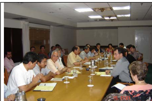
Cuarta Ronda del TLC. Reunión de Parlamentarios colombianos con negociadores de Estados Unidos, Fajardo, Puerto Rico, septiembre de 2004.

Los objetivos de Colombia en la negociación de bienes industriales se orientaron a obtener acceso preferencial permanente para todas las exportaciones del sector, que vienen registrado una dinámica notable en los años recientes y son importantes generadores de valor agregado en la economía; definir reglas de juego claras en el comercio de bienes industriales entre los dos países; y establecer condiciones adecuadas de transición para el ingreso de productos industriales de los Estados Unidos a Colombia. Se buscó generar condiciones propicias para impulsar la exportación de nuevas manufacturas.