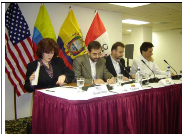
Sexta Ronda del TLC. Rueda de prensa, Tucson, Estados Unidos, noviembre de 2004.

Además de los temas mencionados, que corresponden de forma específica al comercio de productos industriales, agropecuarios y servicios, el TLC contiene otras disciplinas relacionadas directamente con el acceso a mercados y que se aplican al comercio de mercancías. Se trata de los obstáculos técnicos al comercio, las reglas de origen, los procedimientos aduaneros y las salvaguardias.