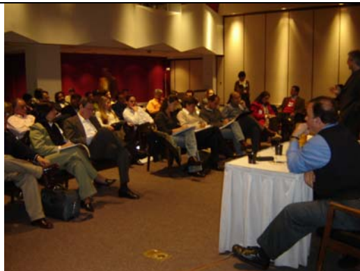
Octava Ronda del TLC. Sesión del Cuarto de al lado en el BID, Washington, Estados Unidos, marzo de 2005.

El TLC crea un margen de seguridad para los empresarios en relación con la competencia en los mercados. Difícilmente se enfrentará un empresario a la conformación de monopolios en su sector de actividad, que restrinjan su presencia en el mercado.