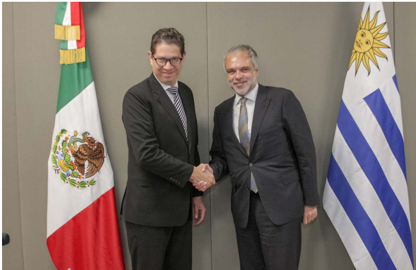
México y Uruguay celebran la V Reunión de la Comisión Administradora del Tratado de Libre Comercio