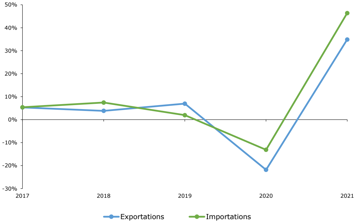
Graphique 2.2 Variation du commerce des marchandises et des services